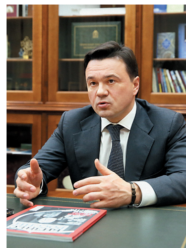
Андрей Воробьёв, губернатор Московской области