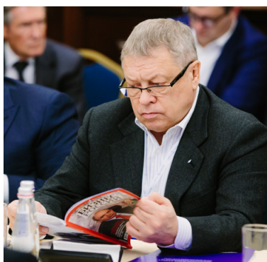
Игорь Зюзин, председатель совета директоров ОАО «Мечел»