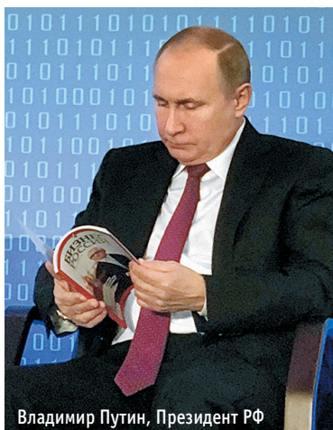
Владимир Путин, Президент РФ