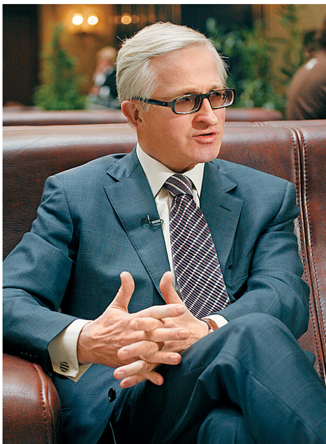
Александр ШОХИН, президент РСПП, председатель редакционного совета

Р ад представить вам журнал «Бизнес России». Я принял предложение возглавить его редакционный совет, но это не значит, что издание является печатным органом РСПП. Напротив, как президент Российского союза промышленников и предпринимателей, я рассматриваю этот журнал как ещё одну публичную площадку для обсуждения актуальнейших вопросов экономического развития страны с участием всех слоёв и объединений бизнеса, государственной власти и экспертного сообщества. Идеология журнала – партнёрство, здесь возможны и даже необходимы заинтересованные дискуссии, в ходе которых и должны формироваться оптимальные решения. Ведь бизнес и государство, столица и регионы, собственники и менеджеры компаний – не конкуренты, а именно партнёры. Ведь только при таком подходе можно построить по-настоящему сильное государство, где голос каждого может быть услышан. У нашего партнёрства гораздо более высокий статус: мы СОТРУДНИКИ – в том смысле, что вместе в ответе за свою страну, за её настоящее и будущее.