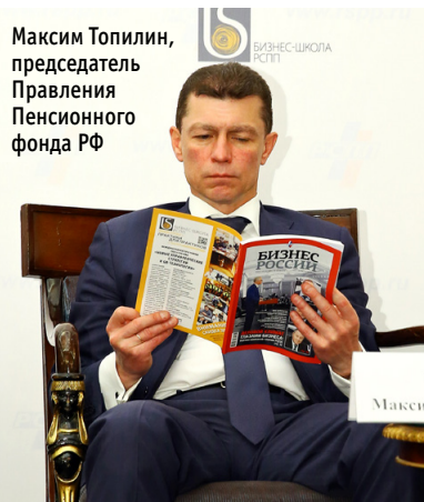
Максим Топилин, председатель Правления Пенсионного фонда РФ