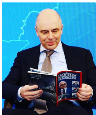
Антон Силуанов, Министр финансов России