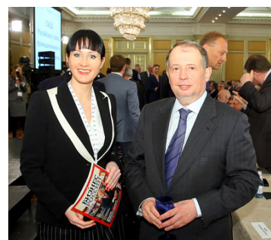
Владимир Лисин, председатель совета директоров ПАО «Новолипецкий металлургический комбинат», председатель Регионального объединения работодателей «Союз промышленников и предпринимателей Липецкой области»