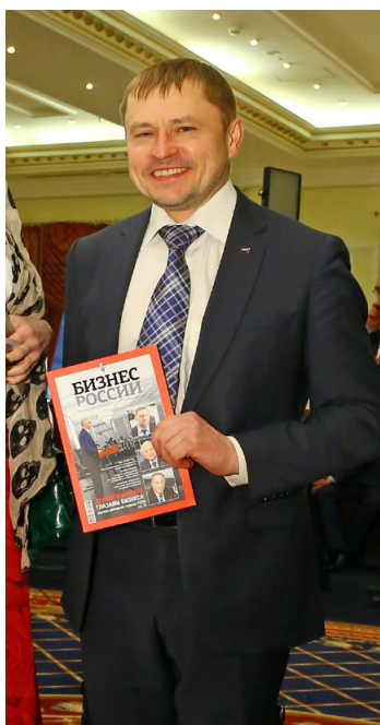
Александр Калинин, президент «Опоры России»