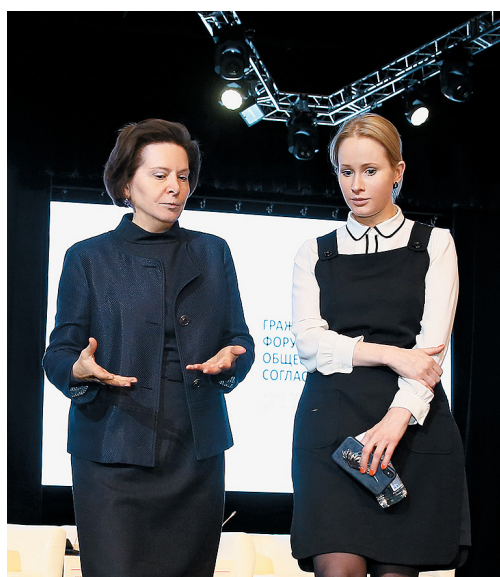
Наталья Комарова, губернатор Ханты-Мансийского автономного округа – Югры