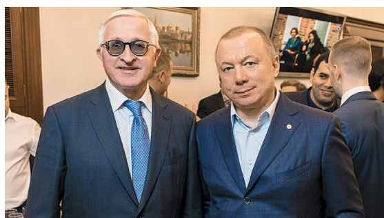
Александр Шохин, президент РСПП, Владимир Резников, председатель Правления консорциума «Объединённый Промышленный Комплекс», президент Международного общества «Рыбаки & Охотники»