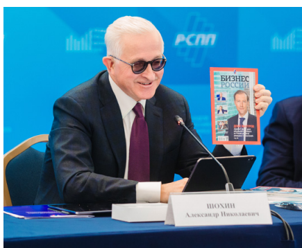
Александр Шохин, президент РСПП