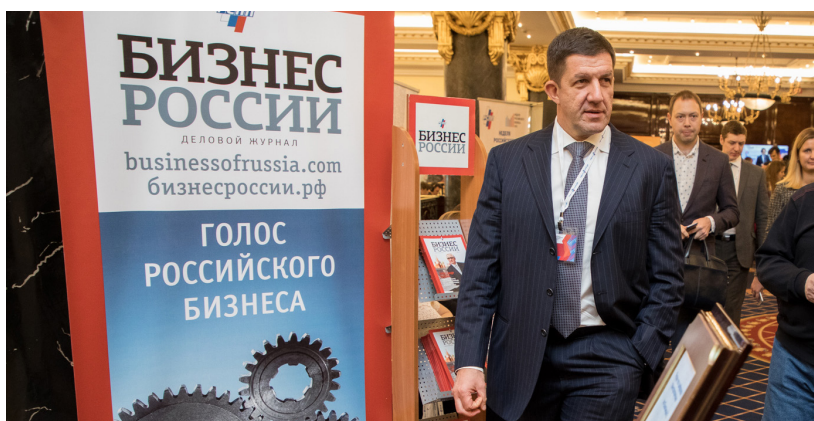
Михаил Осеевский, президент ПАО «Ростелеком»