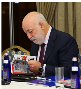
Виктор Вексельберг, председатель совета директоров группы компаний «Ренова»

Члены Бюро Правления РСПП, члены Правления РСПП, руководители региональных отделений РСПП.