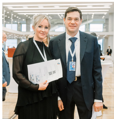
Алексей Мордашов, председатель совета директоров ПАО «Северсталь»