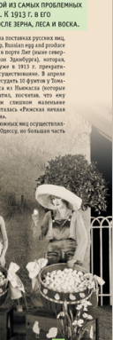
Традиционные русские костюмы