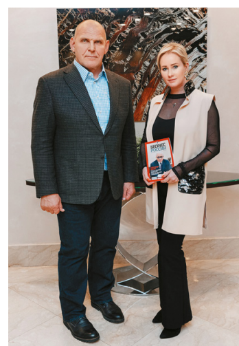
Александр Карелин, трёхкратный победитель Олимпийских игр (греко-римская борьба), Герой Российской Федерации, сенатор Российской Федерации