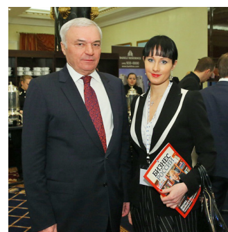
Виктор Рашников, председатель совета директоров ПАО «ММК»