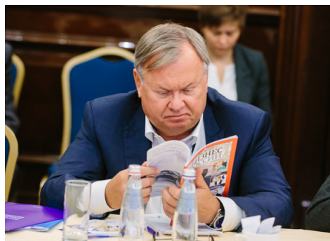
Андрей Костин, президент – председатель Правления ВТБ