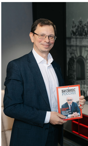
Никита Анисимов, ректор Высшей школы экономики