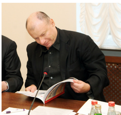
Владимир Потанин, президент – председатель Правления ПАО «ГМК "Норильский никель"»